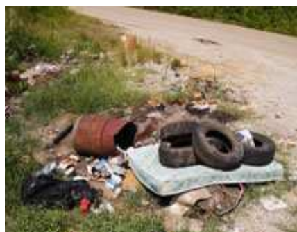
Voici un exemple de dépotoir sauvage.

Les métaux ferreux qui sont laissés dans la nature, comme les carcasses d'automobiles, ont une forte tendance à s'oxyder avec le temps. Les oxydes de fer ainsi créés, lorsque présents en grande concentration, peuvent avoir un impact dommageable sur l'environnement. Laissés au cœur d'un milieu acide, les métaux se transformeront en sels nocifs pour la santé humaine et l'environnement. Le meilleur moyen de se départir de ces résidus en toute sécurité est de les acheminer à l'Écocentre de Matane ou encore chez un ferrailleur de votre région.