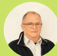
JEAN-ROLAND LEBRUN Préfet suppléant, Secteur Sud